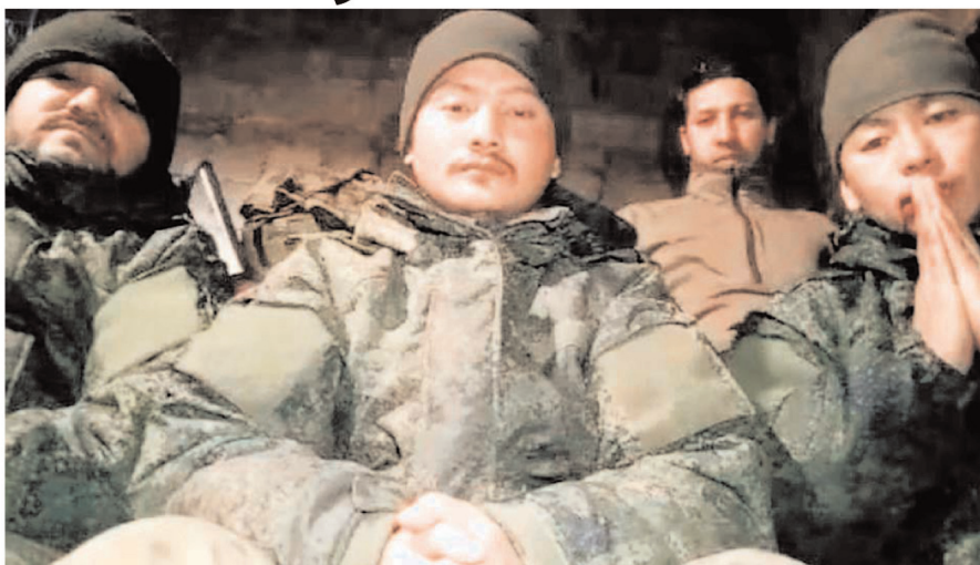
दिसंबर में 6 नेपाली मारे गए थे

भारत और नेपाल के बीच अच्छे संबंध हैं इसलिए हम भारत सरकार से अपील करते हैं कि वो हमें यहां से रेस्क्यू करे। हमारे साथ तीन भारतीय युवक भी जंग लड़ रहे थे। भारत सरकार ने उन्हें रेस्क्यू कर लिया है। भारत की एम्बेसी पावरफुल है। हम 30 लोग रूस आए थे। अब सिर्फ 5 ही बचे हैं। हमारी मदद करें।