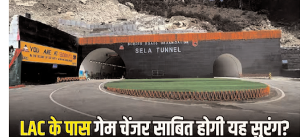
LAC के पास गेम चेंजर साबित होगी यह सुंया?