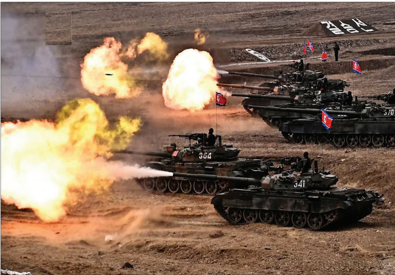
उत्तर कोरियाई सेना अपने शीर्ष नेता किम जोंग उन को टैंक व अन्य हथियारों की मारक क्षमता दिखाती हुई।