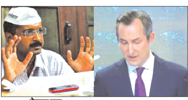
नईदिल्ली: दिल्ली के मुख्यमंत्री अरविंद केजरीवाल की गिरफ्तारी के बाद अमेरिका ने इस मुद्दे पर अपना मुह खोला। अमेरिकी विदेश विभाग के प्रवक्ता मैथ्यू मिलर ने पिछले बुधवार को कहा, अमेरिका निष्पक्ष सुनवाई चाहता है। इसके बाद दिल्ली में तैनात अमेरिकी राजनयिक को बताया था। उस समन के बाद वाशिंगटन ने एक बार फिर अपना मुह खोला। मैथ्यू मिलर ने कल केजरीवाल के एक बार फिर कहा, अमेरिका इस पूरे मामले पर नजर रख रहा है। इस बीच, उन्होंने यह भी बताया कि वे दिल्ली में तैनात अमेरिकी उप राजदूत को बुलाने के मामले पर भी विचार कर रहे हैं।