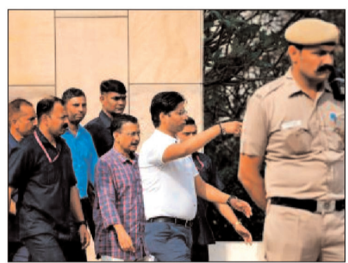
पत्नी बोली-केजरीवाल की तबीयत ठीक नहीं

नई दिल्ली( एजेंसी )। शराब नीति केस में राजु एवेन्यू कोर्ट ने दिल्ली के मुख्यमंत्री अरविंद केजरीवाल की ईडी में हिरासत चार दिन और बढ़ा दी है। वे एक अप्रैल तक हिरासत में रहेंगे। बुधवार को कोर्ट में 39 मिनट सुनवाई चली। केजरीवाल ने खुद अपने केस की पैरवी की। वे ऐसा करने वाले देश के पहले सिटिंग सीएम बन गए हैं। ईडी ने कोर्ट से केजरीवाल को 7 दिन की कस्टडी और मांगी थी। केजरीवाल ने अपनी गिरफ्तारी का विरोध करते हुए कहा कि इस केस में मेरा नाम सिर्फ चार जगह आया है। 4 स्टेटमेंट दिए गए और उनमें से कोर्ट के सामने दो बयान लाया गया, जिसमें मुझे फंसाया गया। क्या ये 4 स्टेटमेंट एक मुख्यमंत्री को गिरफ्तार करने के लिए काफी हैं? इसके जवाब में ईडी ने कहा- मुख्यमंत्री कानून से ऊपर नहीं हैं। वहीं, कोर्ट में पेशी के लिए जाते वक्त उनसे पूछा गया कि एलजी ने कहा था कि सरकार जेल से नहीं चलेगी। इसके जवाब में केजरीवाल ने कहा कि ये पॉलिटिकल पड्यंत्र है, जनता इसका जवाब देगी।